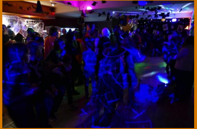
On enchaîne sur une soirée d'enfer...