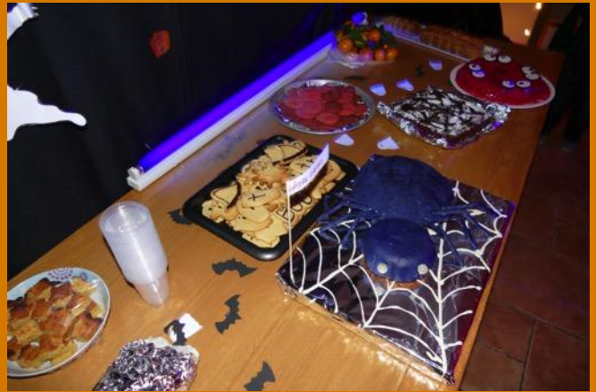
Avec concours de cuisine et buffet tout à fait ragoûtants !