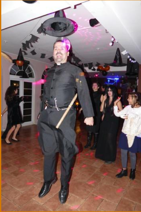
Encore quelques « Hat jumps »