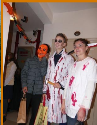
Puis ils sont rejoints par les plus grands