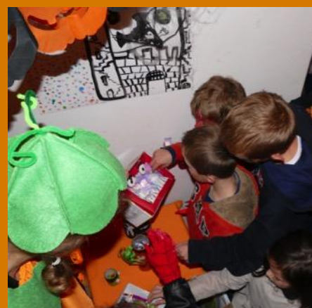
Et c'est parti pour une diabolique chasse aux bonbons