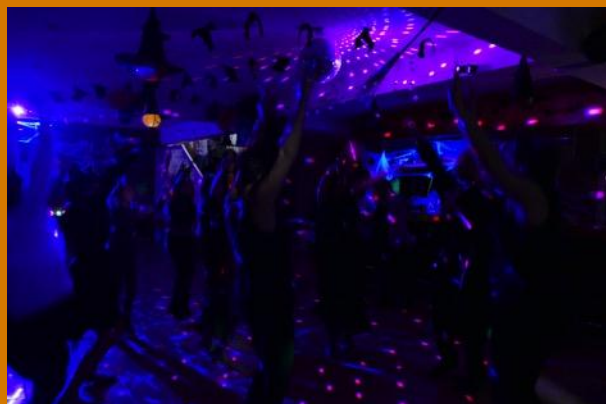
Et le DJ fait monter l'ambiance...