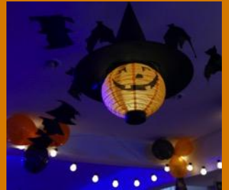
Dans un club métamorphosé en antre maléfique...