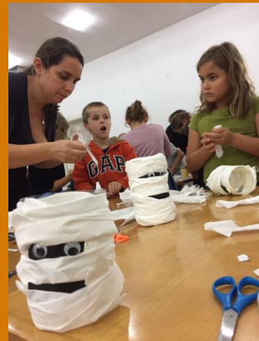
Les plus jeunes commencent par un atelier bricolage